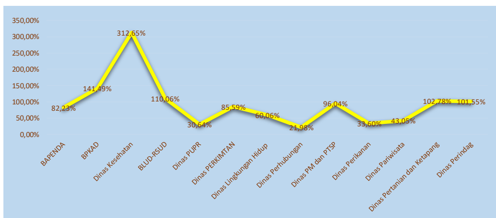
Gambar 3.7 Grafik Kontribusi OPD PAD terhadap Capaian PAD Kota Baubau Tahun 2024

Beberapa OPD telah menyumbang PAD di atas angka 100%, dari data ini dapat diambil kesimpulan bahwa potensi Pendapatan Asli Daerah di Kota Baubau sangat besar dan perlu digali dan dikelola dengan baik oleh OPD Pengampu PAD. Dukungan sarana dan prasarana pada pengelolaan retribusi daerah perlu dilakukan terutama pada Retribusi Parkir, retribusi Sampah, Retribusi Rusunawa dan sebagainya. Berikut Kurva capaian PAD pada OPD Pengampu.